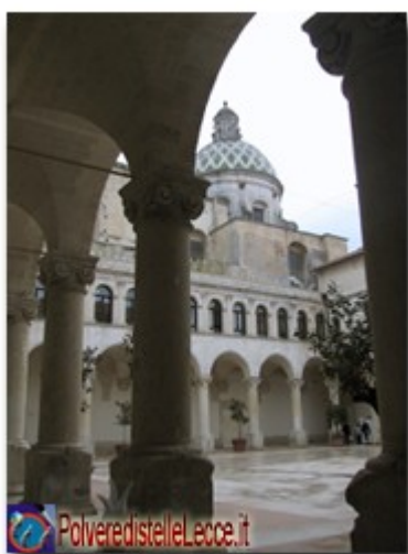
Sede Rettorato ( Le )